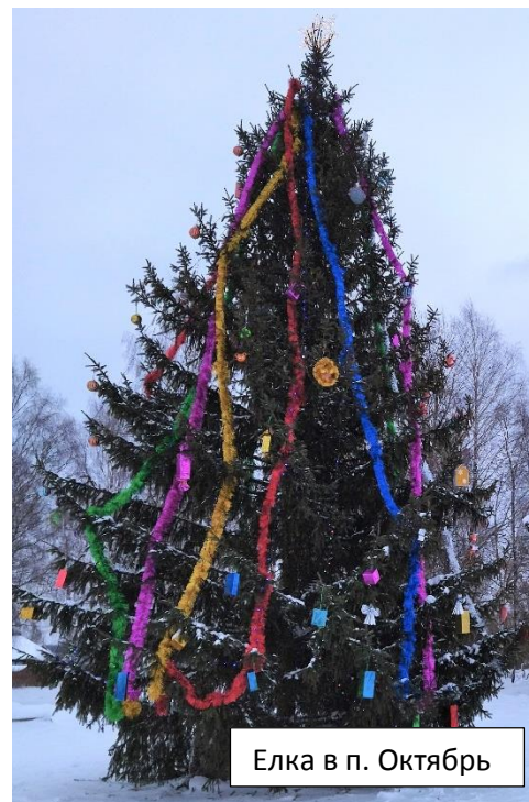
Елка в п. Октябрь

С помощью неравнодушных жителей поселения для взрослых и детей уже залиты ледовые катки в с.Воскресенское и с.Мокеиха, новогодние праздники можно провести на свежем воздухе с пользой для здоровья.