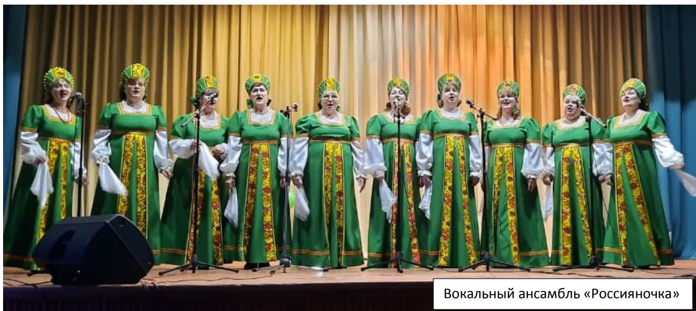
Вокальный ансамбль «Россияночка»

Администрация Октябрьского сельского поселения искренне поздравляет коллектив вокального ансамбля «Россияночка» с.Воскресенское с 30-летним юбилеем! Желает вам воплощения всего задуманного, новых творческих достижений, аншлагов и преданных зрителей! Крепкого здоровья, добра и благополучия вам и вашим семьям!